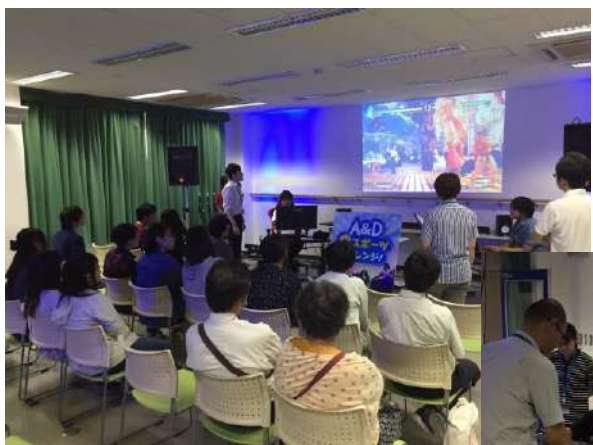
イベント運営体験