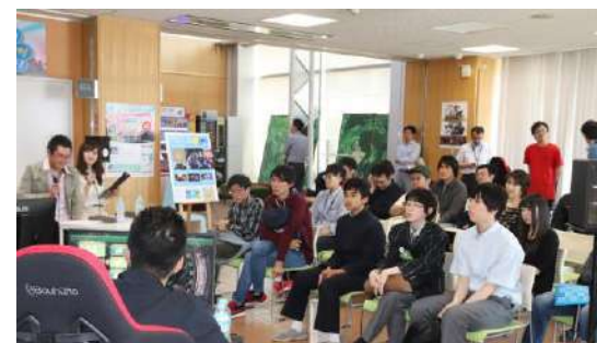
実況・解説 ツボプラス 氏 ※技の解説と対戦実況