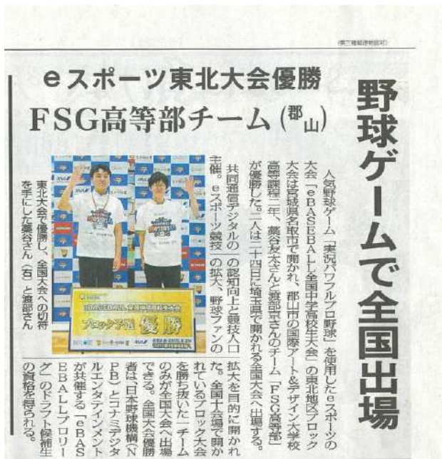
福島民報 8月8日掲載