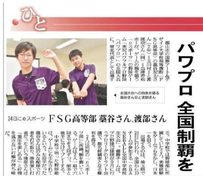
福島民報 8月12日掲載