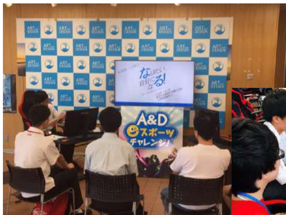
eスポーツプレイヤー体験