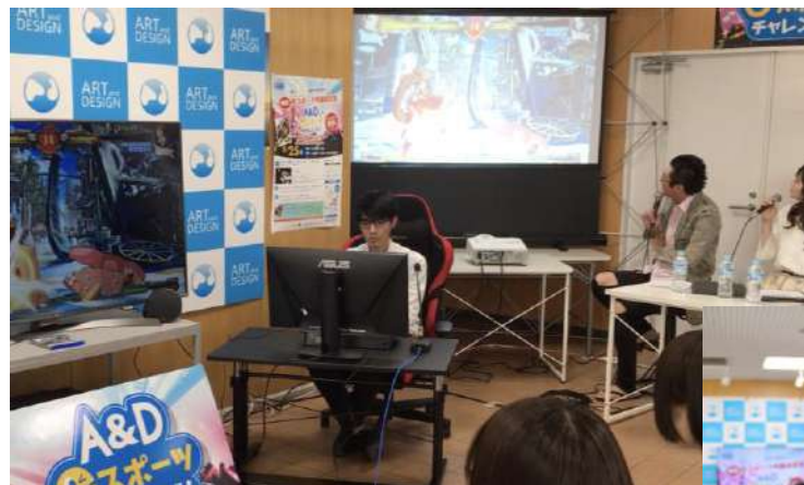
ゲーム実況・配信体験