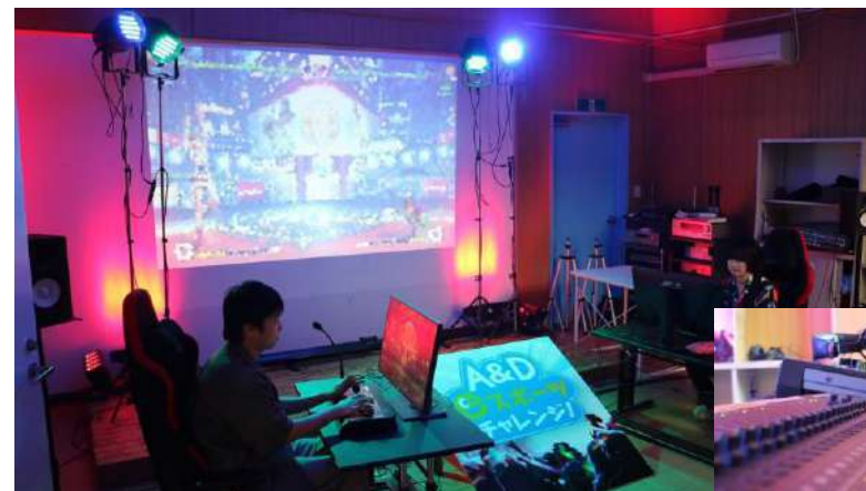
音響・照明演出体験